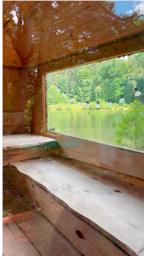
Sauna mit Seeblick