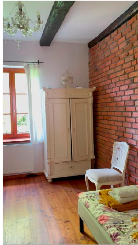
Einblick in 2-Bett-Zimmer