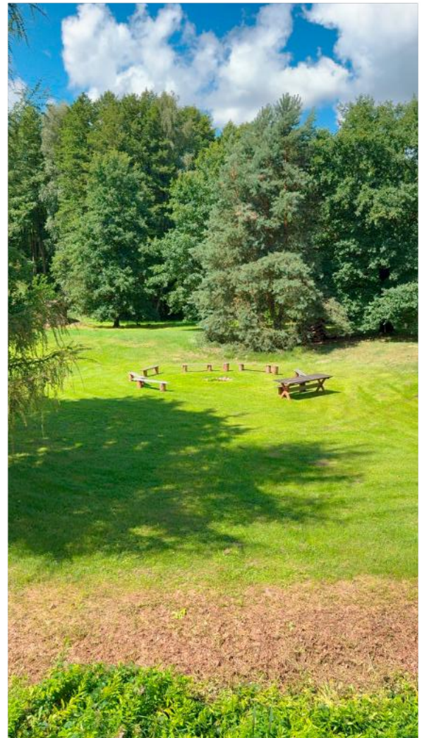
Ausblick vom Yogahaus - Lagefeuerplatz