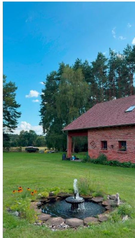
Yogahaus, WC, Duschen, Parkplatz